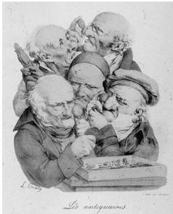
Lithographie de L. Boilly