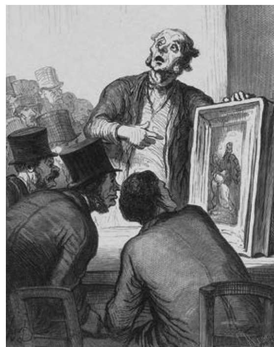
Gravure sur bois d'après Daumier (détail)