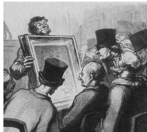
Gravure sur bois d'après Daumier (détail)