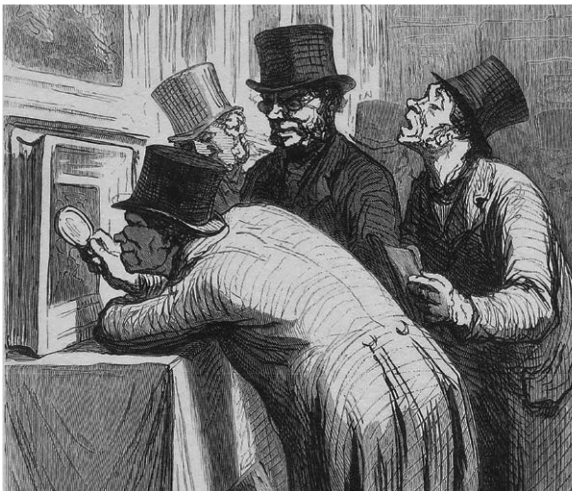
Gravure sur bois d'après Daumier (détail)

L'expert de la CNE met en œuvre tous les moyens d'information disponibles au moment où est réalisée son estimation, en l'occurrence la connaissance des prix réalisés sur le marché pour des biens comparables à celui qui fait l'objet de sa mission ou en tout cas ayant quelque analogie avec lui. Quitte ensuite à interpréter ces informations pour estimer au plus juste le bien concerné, en fonction de sa rareté, de son intérêt artistique, historique, patrimonial ou autre.