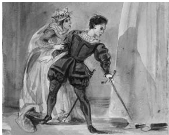
E. Delacroix. Hamlet et sa mère : « A rat ! » . Pinceau et lavis brun sur graphite.

Disons que « je m'appuie sur moi ». Je suis sûr de tous les dessins de ma collection, j'en mets ma tête à couper ! Ayant publié de nombreux articles et été commissaire de plusieurs expositions, je suis constamment